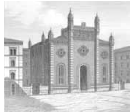
Synagoge Tempelgasse Wien 2 vor der Zerstörung 1938

Danach kam der eigentliche Höhepunkt der Veranstaltung: Chovkah Raban, Partisanin und Überlebende des Warschauer Ghettos, die 1949 zu den Gründern des Kibbutz zählte, berichtete unter dem Titel: „Ohne Abschied“ über ihre Erlebnisse aus der schrecklichen Zeit und beantwortete auch die zahlreichen Fragen aus dem Publikum. Nach dem – sehr schmackhaften! – Mittagessen besuchten wir das Museum und vor allem den neu gestalteten „Treblinka-