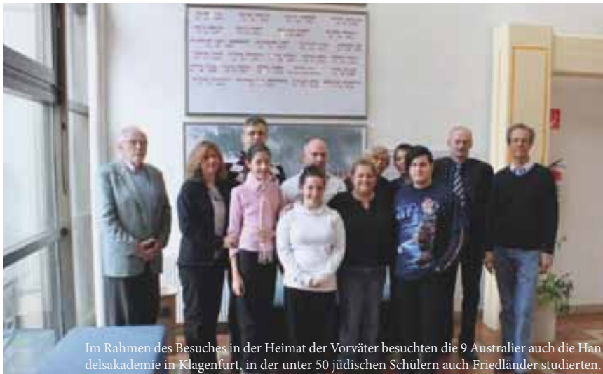
Im Rahmen des Besuches in der Heimat der Vorfäter besuchten die 9 Australier auch die Handelsakademie in Klagenfurt, in der unter 50 jüdischen Schülern auch Friedländer studierten.