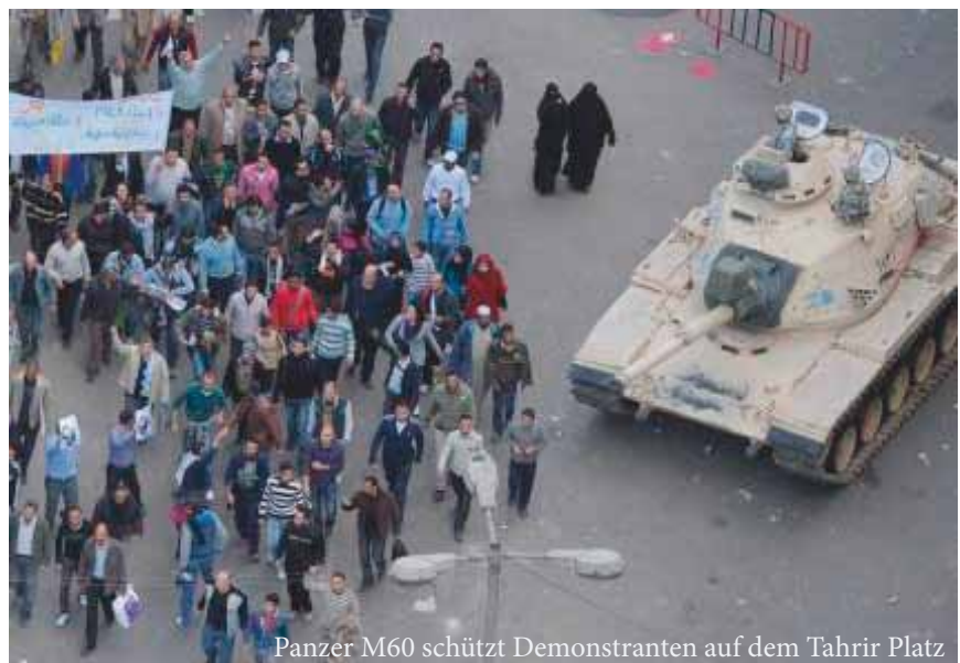
Panzer M60 schützt Demonstranten auf dem Tahrir Platz

Die ägyptische Armee ist die größte Militärmacht in Afrika. Sie hat als Wehrpflichtigenarmee mit einer dreijährigen Dienstzeit rund 480.000 Soldaten ständig