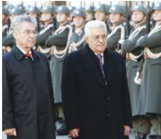
Offizieller Arbeitsbesuch des Präsidenten der Palestine National Authority Mahmud Abbas in Österreich. Empfang mit militärischen Ehren im Inneren Burghof

Da fällt auch auf den Besuch des Präsidenten der palästinensischen Autonomiebehörde beim Bundespräsidenten ein neues Licht. Heinz Fischer informierte den stellvertretenden Ministerpräsidenten Israels Ehud Barak darüber, dass sich Abbas sehr konstruktiv gezeigt hatte. Unser Bundespräsident wird doch nicht blauäugig die Vermittlerrolle von Bruno Kreisky weiterspielen wollen.