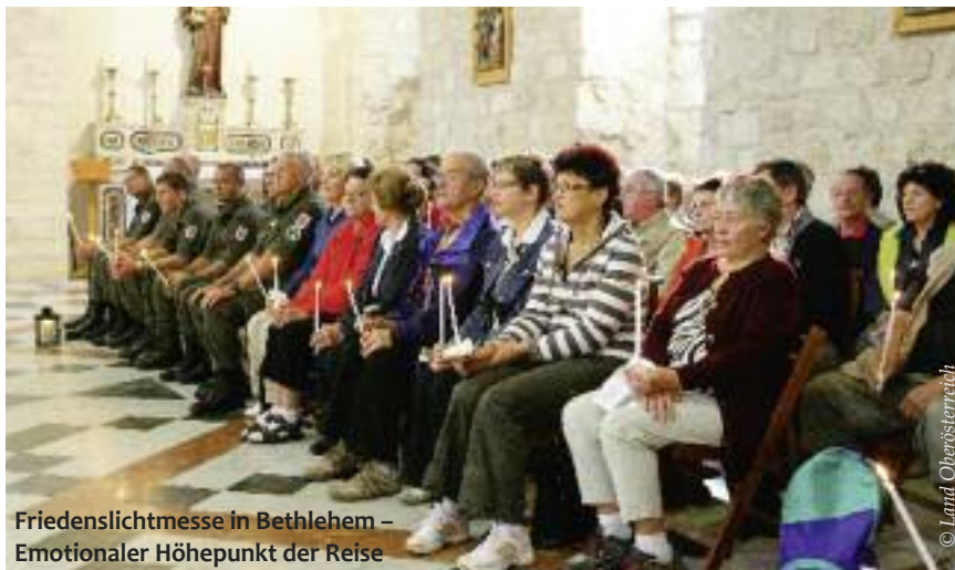
Friedenslichtmesse in Bethlehem – Emotionaler Höhepunkt der Reise

Das Zehnjahresjubiläum des ORF-Friedenslichtes aus Bethlehem brachte 1996 eine wichtige Neuerung: Erstmals begleiteten hunderte Pilger das Friedenslicht auf seiner Reise nach Österreich – die meisten aus Oberösterreich, etliche auch schon bei dieser ersten öffentlichen Pilgerfahrt aus anderen Bundesländern. Es war die Geburtsstunde der Friedenslichtreise von ORF Oberösterreich, die inzwischen zu einem Markenzeichen unseres Studios geworden ist. Für alle Teilnehmerinnen und Teilnehmer ist es aufregende und auch sehr anstrengend, wenn sie sich in der Woche vor dem ersten Adventssonntag auf Pilgerschaft in das Land der Bibel begeben.