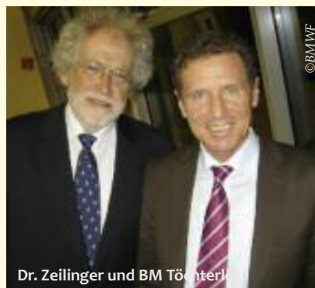
Dr. Zeilinger und BM Töchterle

Es sei im Sinne beider Länder, die Zusammenarbeit im Bereich Wissenschaft und Forschung weiter auszubauen, betonte Wissenschafts- und Forschungsminister Dr. Karlheinz Töchterle bei den Wissenschaftstagen der Österreichisch-Israelischen Gesellschaft am 10. November 2011 in der Wiener Urania. In seinem kurzen Vortrag und der anschließenden Diskussion, an der u.a. auch der Wiener Physiker