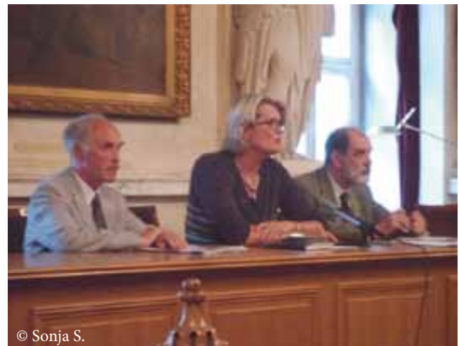
Außenministerin a. D. Ursula Plassnik zwischen den Präsidenten