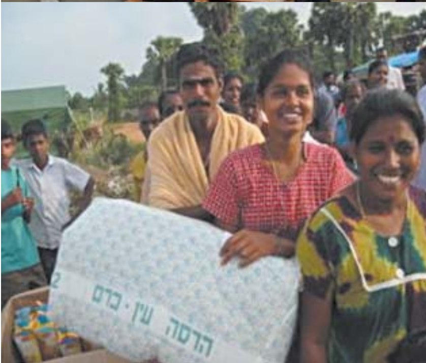
Bild oben: Versendung von Hilfsgütern an Sri Lanka. Darunter: Singalesen mit Bettwäsche mit hebräischem Hadassah-Druck.